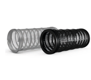
Paneles de cribado del trómel diferentes