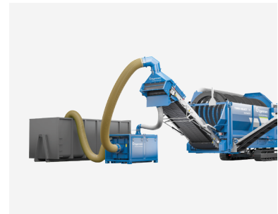
TERRA SELECT Trommelsiebmaschinen